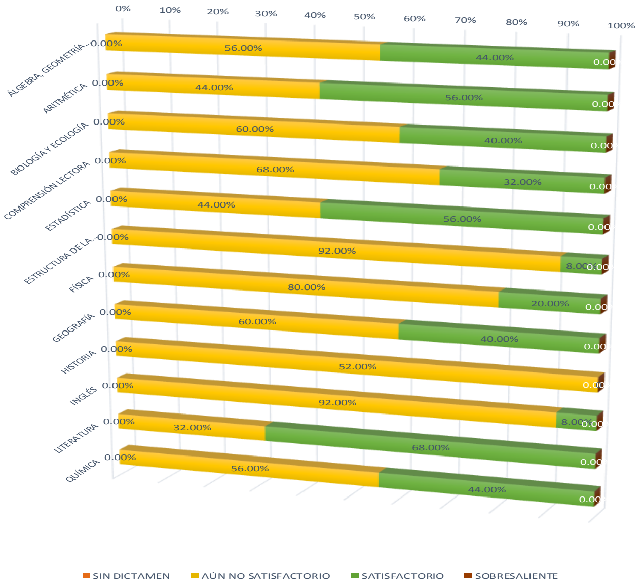
DOMINA 2016 CENTRO EMSaD 29

Objetivo: “Evaluar los contenidos medulares de las competencias disciplinares (conocimientos y habilidades) que los egresados de la Educación Media Superior (EMS) deben dominar”.